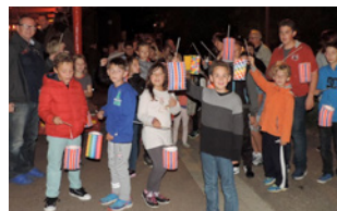
Des lampions pour les 50 ans

La veille un concert pop rock, en l'église Saint Arnould, interprété par "les Anges LS" avait ouvert les festivités. A la tombée de la nuit, samedi, de jolis lampions ont été distribués à 50 enfants et parents. Puis un petit circuit magique a été improvisé sur la fête. Les enfants ravis sont repartis avec leur lanterne. "Je suis trop contente de le garder. Ça me fera un trop beau souvenir !" confiait une petite fille du village.