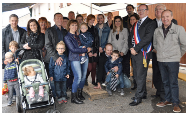
Les nouveaux arrivés reçus par la municipalité