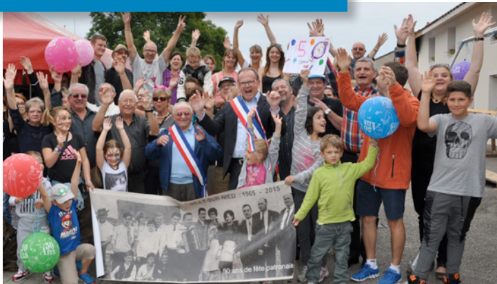
Deux maires pour un anniversaire