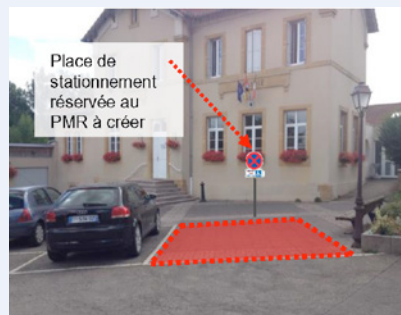
Place de parking réservée devant la mairie