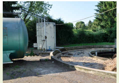
La station d'épuration est quotidiennement entretenue par l'ouvrier communal

Pour le bon fonctionnement du réseau d'assainissement et donc le bien-être de tous, veillez à ce qu'il ne serve qu'à évacuer les eaux usées !