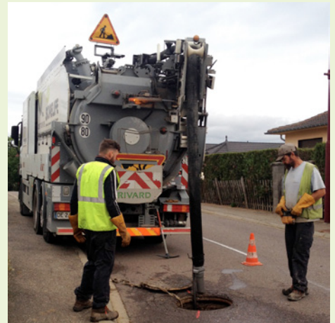
Une inspection télévisuelle a permis de découvrir plusieurs anomalies